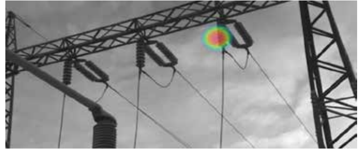
Beispiel für die Beurteilung des Schweregrades für Si124-IPS

Die FLIR Si124-PD ist ein einfach zu bedienendes, eigenständiges System zur Erkennung von Teilentladungsproblemen in elektrischen Hochspannungsanlagen. Diese leichte und einhändig zu bedienende Lösung wurde speziell für Konstruktionsexperten entwickelt, die damit Probleme bis zu zehnmal schneller erkennen können als mit herkömmlichen Methoden. Mit ihren 124 Mikrofonen erzeugt die Si124-PD ein präzises akustisches Bild, das Ultraschallinformationen auch in lauten Umgebungen über weite Entfernungen visuell darstellt. Das akustische Bild wird in Echtzeit auf ein digitales Kamerabild überlagert, sodass der Benutzer die Schallquelle genau lokalisieren kann. Der Benutzer kann dann mithilfe der FLIR Advanced Severity Assessment-Analyse den Schweregrad des Problems klassifizieren und Empfehlungen für Maßnahmen zur Lösung des Problems geben. Die Si124-PD verfügt über ein Plugin, mit dem der Benutzer akustische Bilder zur Offline-Bearbeitung, Analyse und erweiterten akustischen und thermografischen Berichterstellung in die FLIR Thermal Studio Suite importieren kann. Die Analyse und Berichterstellung vor Ort kann auch über den Cloud-Dienst FLIR Acoustic Camera Viewer erfolgen. Durch eine regelmäßige Wartungsroutine können Einrichtungen mithilfe der FLIR Si124-PD Geld für Reparaturen einsparen und die Zuverlässigkeit ihrer Anlagen erhöhen.